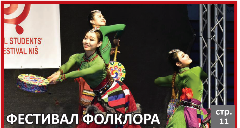
ФЕСТИВАЛ ФОЛКЛОРА стр. 11