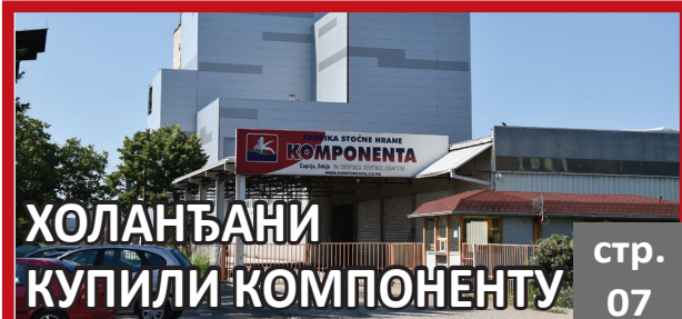
ХОЛАНЂАНИ КУПИЛИ КОМПОНЕНТУ стр. 07